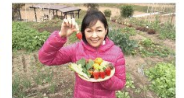
【放送日時】1月28日(日) ●Eテレ/後6:00~6:29